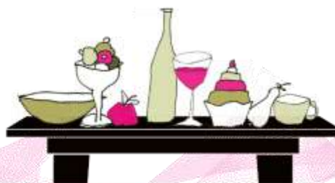
Suite's „Tischlein deck Dich“

Nur auf Vorbestellung für mindestens zwei Personen. Kinder werden mit 1,-€ pro Lebensjahr berechnet. Tickets zum Verschenken im Café erhältlich.